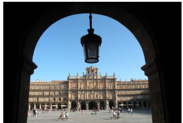
El Greco in seiner Heimatstadt Toledo (oben) Plaza Mayor in Salamanca